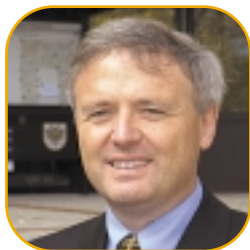
Klaus Brodbeck - Landrat de l'Ortenaukreis