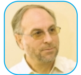
Théo Schnee - Maire d'Erstein Président de la Communauté de Communes du Pays d'Erstein

"Constituée par ses grandes villes, la "colonne vertébrale" de l'Alsace a besoin "d'espaces intervertébraux" nombreux et forts pour lui permettre de fonctionner de façon souple.